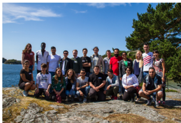
FNUF's integrationsprojekt, juni 2018

Find FNUF's principprogram og udtalelser på www.fnuf.org